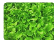
炒チャオ (炒めるレタス)