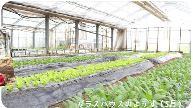
ガラスハウスのようす (5月)