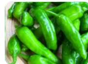
豊産ししとう (ししとう)

ロイシーコーン 品種改良をかさね て作られた極甘の 白い (!)とうも ろこし。生でも!