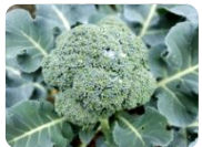
夢ひびき (ブロッコリー)