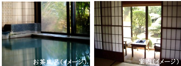
お茶風呂(イメージ)