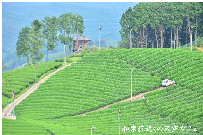
和東荘近くの天空カフェ

宇治茶の郷、京都府和東町にある、お茶を五感で愉しむ宿です。 「府道5号線に入ると、そこから空気が変わる」そんな声をよく聞きます。不便さと引き換えに今も残る、美しい水の流れと四季を感じさせる豊かな森。山を覆う茶畑。 鎌倉時代から現代まで、受け継がれてきた茶づくりの歴史のなか、山を切り拓いてきた先人たちの努力と、それを守り続ける、今日の茶業従事者の努力の賜物です。ここにしかない鮮やかな景色とともに、美味しいお茶を愉しみながら、ゆったりとお過ごしください。