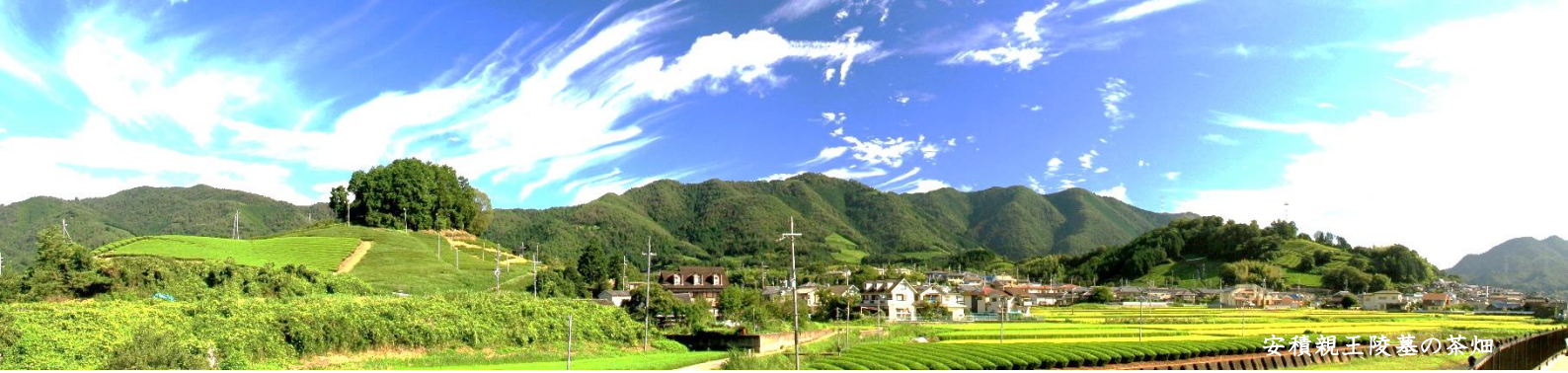
安積親王陵墓の茶畑

宇治茶の郷、京都府和東町にある、お茶を五感で愉しむ宿です。 「府道5号線に入ると、そこから空気が変わる」そんな声をよく聞きます。不便さと引き換えに今も残る、美しい水の流れと四季を感じさせる豊かな森。山を覆う茶畑。 鎌倉時代から現代まで、受け継がれてきた茶づくりの歴史のなか、山を切り拓いてきた先人たちの努力と、それを守り続ける、今日の茶業従事者の努力の賜物です。ここにしかない鮮やかな景色とともに、美味しいお茶を愉しみながら、ゆったりとお過ごしください。